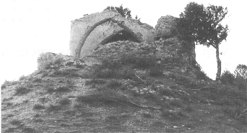
S ta Engracia, la antigua iglesia de Asteruelas. Imagen tomada desde el exterior de lo que fue la cabecera del templo.

rios, formando un anexo al protocolo de 1573 de Miguel Español Menor (se trata de copias de los documentos originales) o en el Archivo Municipal de Perdiguera (San Vicente, 1979). Las malas condiciones económicas por las que pasó el Monasterio de Rueda le llevó a vender algunas propiedades, entre ellas Asteruelas, que fue comprada por Antonio Pertusa el 26 de mayo de 1414 con el objeto de cederla al concejo de Perdiguera a fin de sufragar con sus rentas una capellanía que constituyó en la iglesia de este pueblo. Dos años