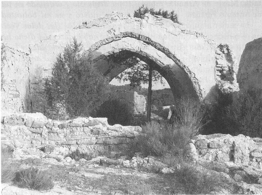
S ra Engracia. Imagen tomada desde los pies. La vegetación se adueña del terreno. Algunos arcos apuntados sobreviven a duras penas. En primer término, lo que parece suelo no es más que el muro de los pies, tumbado casi en una pieza.

topónimos parecen estar encubriendo un poblado de época medieval (El Villar, Val Pardi-