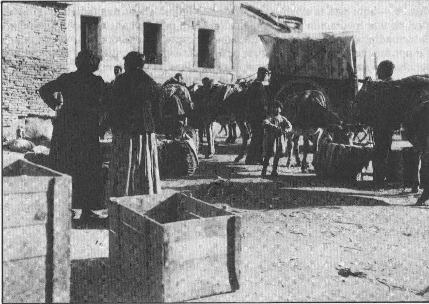
Huesca. Feria, 1928.

es cierto que los primeros herederos del matriarcalismo descubiertos como estructura psicosocial por Bacholder, Morgan y Malinowski fueron simpatizantes nada menos que del nacional socialismo alemán, no es menos cierto que la misma Escuela de Frankfurt y socios como E. Bloch pusieron las cosas en su lugar al reclamar a hijos de la Gran Madre y aguzar al nacional socialismo alemán con un título ganado a pulso: un patriarcalismo fálico-agresivo sin precedentes. Nuestro propio libro nos proporciona pistas críticas al respecto. Pues, en primer lugar, como vejam, La Sabina es no sólo temible sino fascinante (Angela y la Moira) e incluso representa nuestra salvación al escribirlo o sea, cuando ya estamos perdidos. El propio libro parece aquí recomponerse en sus orígenes.