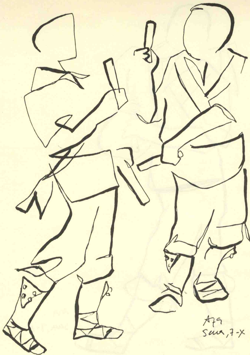
Danzantes. Octubre-noviembre, 1979. J. Alvar.